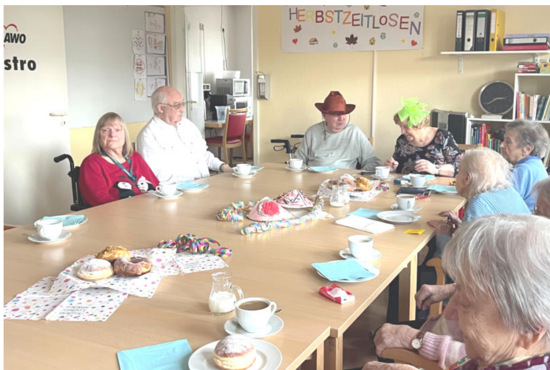
Ausgelassene Stimmung herrschte beim Kreppelkaffee im Horst-Warnecke-Haus des Betreuten Wohnens der AWO Obertshausen.

stimmungsvoll ging es tags darauf im Bistro des Ingeborg-Kopp-Hauses des Betreuten Wohnens an der Friedrich-Ebert-Straße zu. „Die Kreppelnachmittage zeigen einmal mehr, wie wichtig solche gemeinschaftlichen Veranstaltungen für das Mitei-