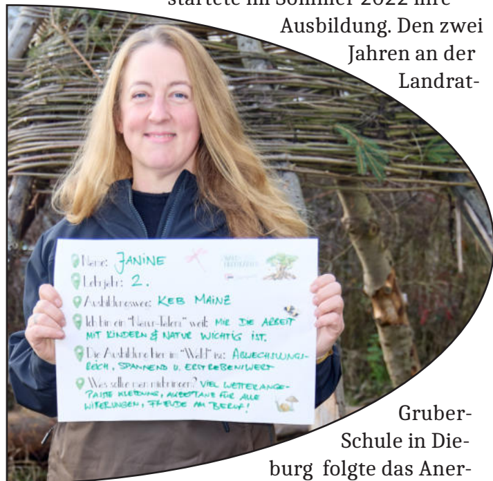
Gruber-Schule in Dieburg folgte das Aner-

Ausbildung. Den zwei Jahren an der Landrat-