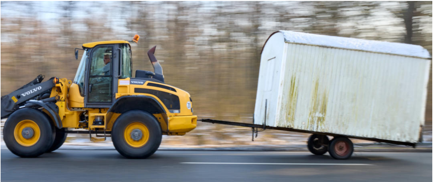
Der Tieflader samt Bauwagen nimmt Fahrt in Richtung neuem Standort an der evangelischen Dietrich-Bonhoeffer-Gemeinde auf.