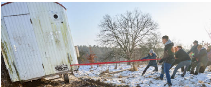
Mit vereinten Kräften und Bändern geht es voran.

Der Neustart der Wald- und Naturkindergarten-Gruppe der „Wilden Rehkids“, die viele Jahre in Lämmerspiel ihr Domizil hatte, ist ein gutes Stück näher gerückt. Der fast 40 Jahre alte Bauwagen, der die wenigen Utensilien beherbergt, die der Waldkindergarten benötigt, hatte viele Jahre auf der Lichtung in der Verlängerung der Lämmerspieler Schubertstraße gestanden. Ein Team des Garten-