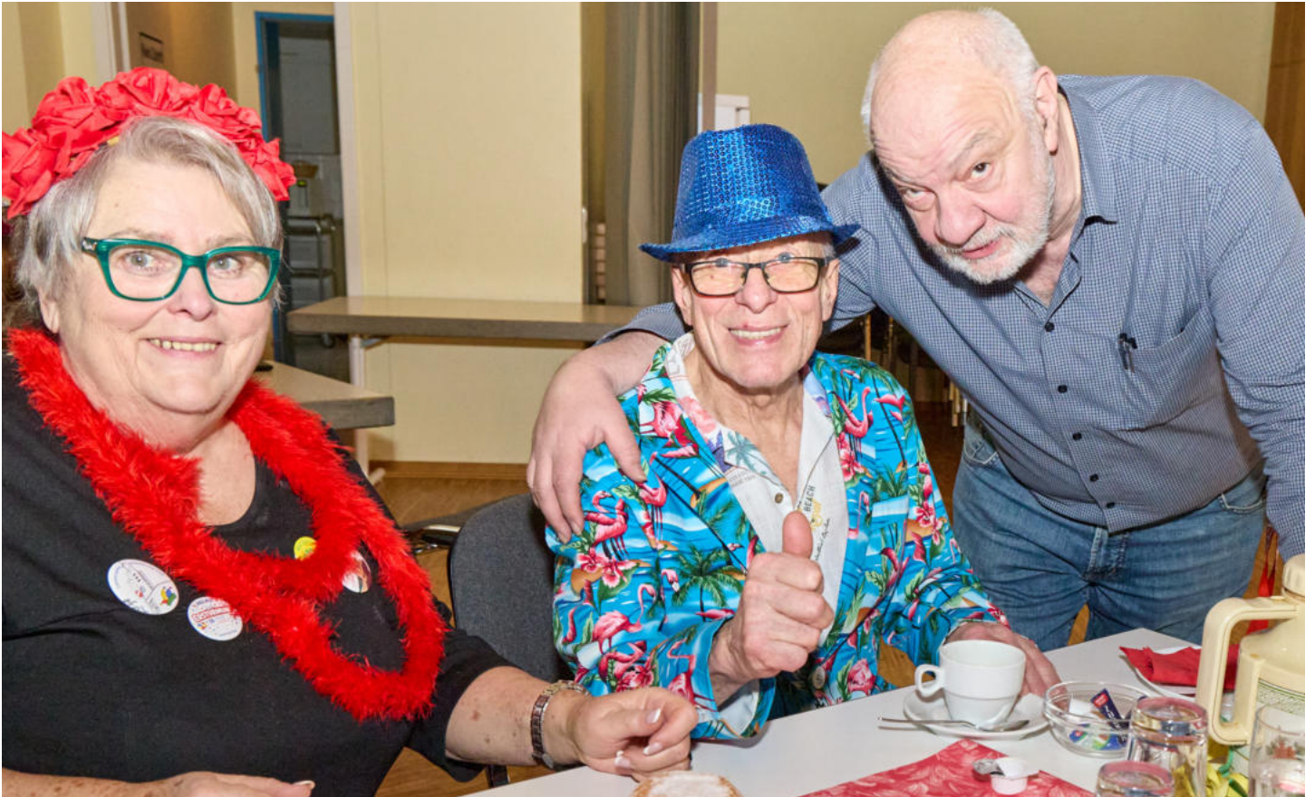
Beste Stimmung herrschte beim närrischen Kreppelkaffee der AWO Mühlheim im AWO-Zentrum an der Fährenstraße.